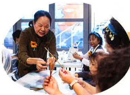
技藝傳承 講座分享