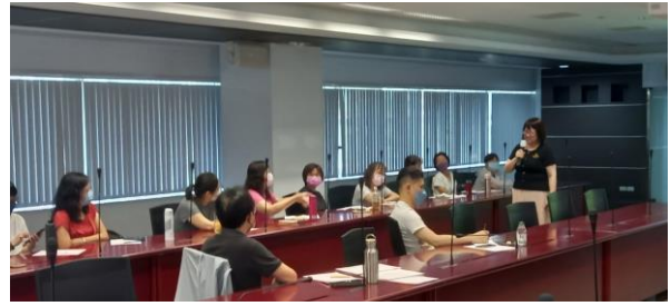
上課實景(多元形式:讀書會) 不同形式至少放置1張成果照片