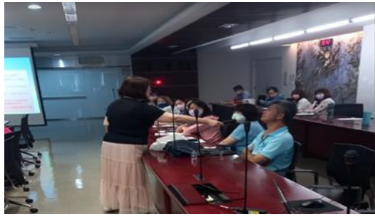
上課實景(多元形式:分組討論) 不同形式至少放置1張成果照片